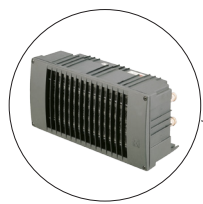
Wasser-Luft Wärmetauscher Silencio 2

Maßarbeit bedeutet für uns Mitdenken und Beraten. Die Wünsche des Kunden und die spezifischen Anwendungen verlangen kreative und praktische Lösungen, damit als Ergebnis ein optimales Heizsystem zur Verfügung steht. Nehmen Sie unverbindlich Kontakt mit uns auf, damit wir mit Ihnen die Möglichkeiten besprechen können, um die beste Lösung für Ihre maritime Heizaufgabe zu finden.